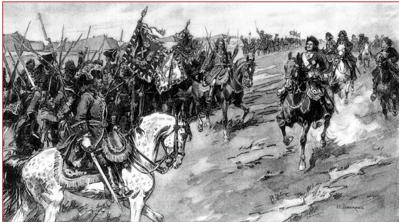
Обращение Петра Великого к войскам перед Полтавским сражением:

Пётр принял решение отказаться от оборонительного сражения и перейти в наступление. Из лагеря без помех от противника, стали выводить пехоту. Войско Петра уже владело «шведской манерой» беспощадной лобовой атаки холодным оружием. Беспрецедентным был не только линейный порядок, но и единое «силовое поле» Русской армии, угро-