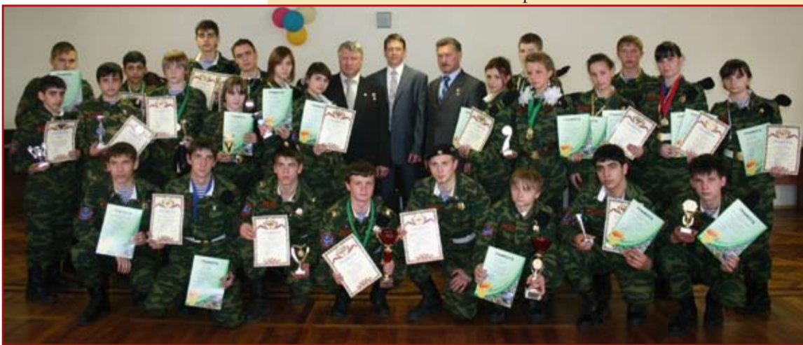
Победители среди команд в старшей возрастной группе: Клуб «Полярис» – I место.