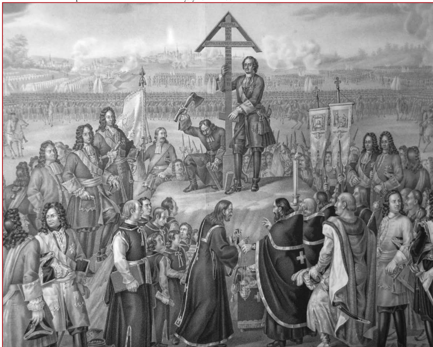
Обращение Петра Великого к войскам при погребении погибших:

«Никто не может более, как вы несли тяготу дневную и ночную за любовь Божию, Матерь Церковь, целость Отечества и за Государя, положили души свои и кровию венчались и подвиги страдальческие явили. Храбрые воины! Вы увенчались страдальческим венцом и предстоите пред престолом Царя Небесного. Поборайте же своими молитвами правому оружию моему, поднятому на благо Отечества!».