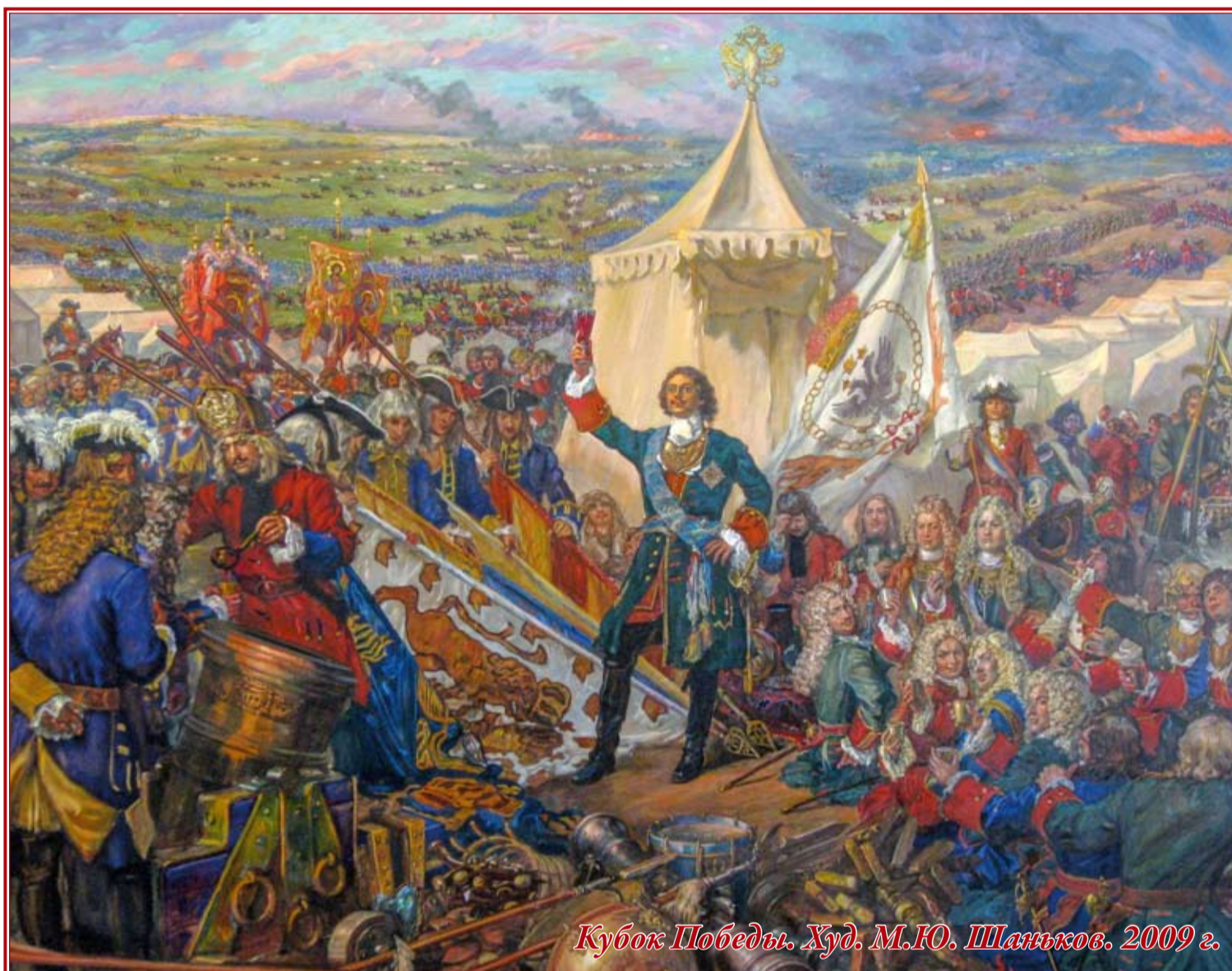
Кубок Победы. Худ. М.Ю. Шаньков. 2009 г.