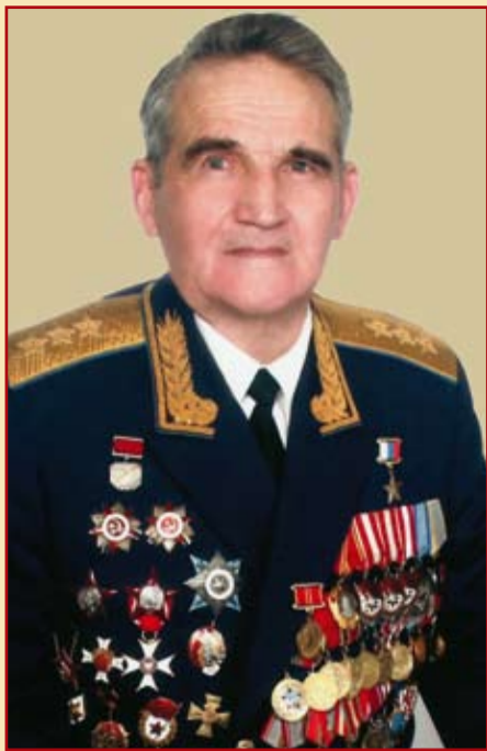
А.П. АНДРЕЕВ Герой России, генерал-полковник авиации, Ассоциация общественных объединений города-героя Москвы

10 лет назад Региональная Ассоциация общественных объединений (РАО-ОМ), при участии ряда общественных организаций, впервые провела на площади Белорусского вокзала г. Москвы историко-художественное представление, посвященное памятной дате – 22 июня (День памяти и скорби).