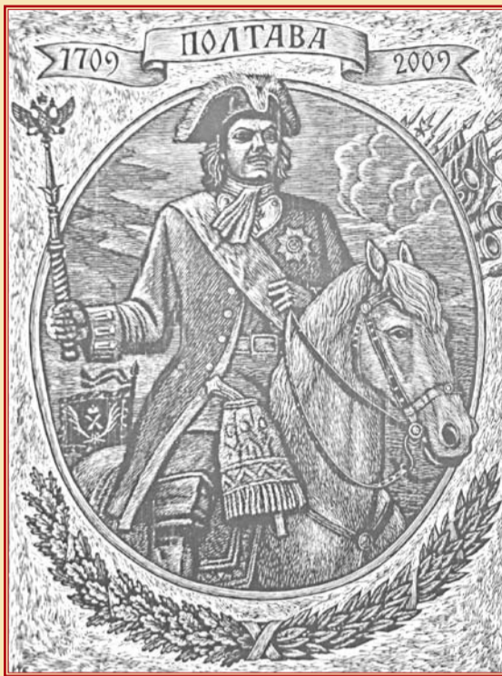
Гравюра «Петр Великий — Герой Полтавы». Худ. С.М. Харламов (2009 г.)