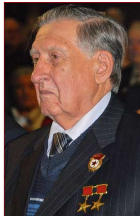
Владимир Иванович ДОЛГИХ Председатель Мосгорсовета ветеранов войны, труда и правоохранительных органов Дважды Герой Социалистического труда

Нас очень беспокоит состояние патриотических чувств нашей молодежи. Но мы - оптимисты! Мы видим, что государство и наша столица стараются, власти тоже обеспокоены ситуацией, которая возникла вокруг российской молодежи, значит не все еще потеряно. Существует