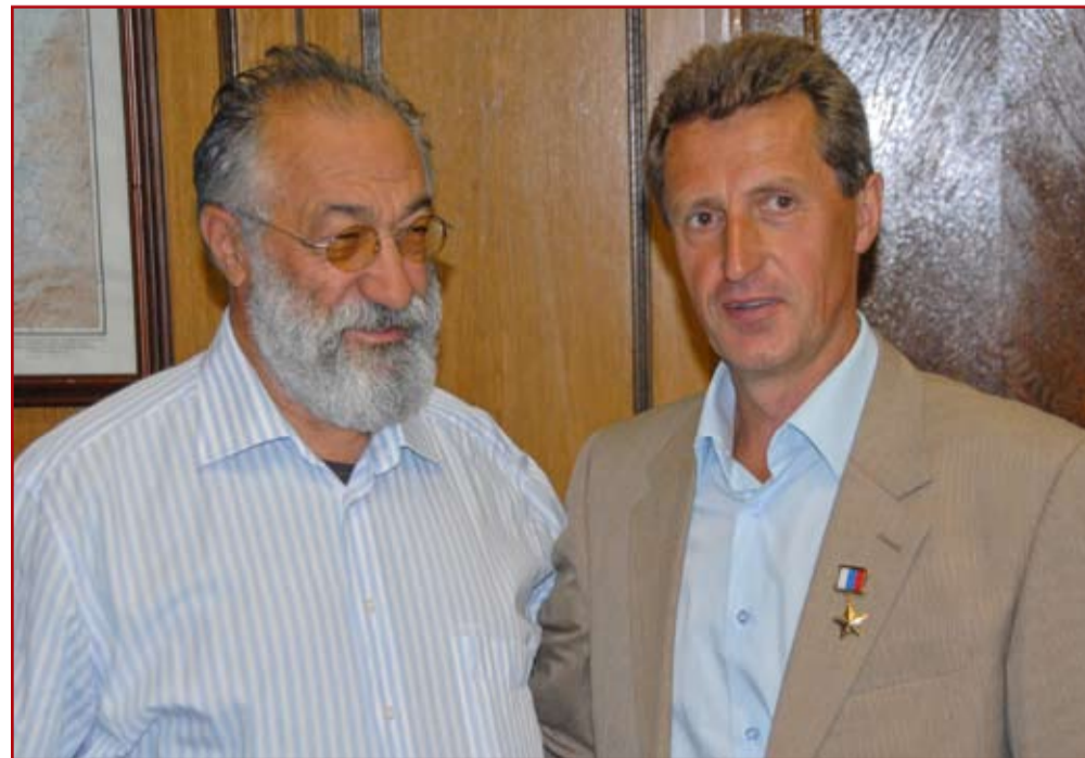
Герой Советского Союза, Герой России А.Н. Чилингаров и Герой России М.Г. Малахов

Научный руководитель экспедиции Павел Филин сообщил, что православные церкви есть практически во всех населенных пунктах, в них ходит местное население — атабаски и эскимосы. Служба идет на русском и алеутском языках, причем Катехизис и часть Священного писания на алеутский язык перевел Апостол Аляски Иннокентий Вениаминов , который после продажи Аляски в 1867 году стал митрополитом Московским и Коломенским. Одной из целей экспедиции является создание карты русского наследия Америки.