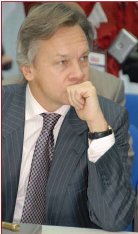
Алексей Константинович ПУШКОВ Директор Института актуальных международных проблем ДипАкадемии МПА РФ, Автор и ведущий аналитической програм- мы «Постскриптум», Профессор МГИМО

С августа 2008 года, когда президент Грузии М. Саакашвили дал приказ о ковровой бомбардировке Цхинвала, медийная ситуация вокруг этой войны существенно изменилась.